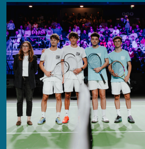
Open Étudiants by INSEC