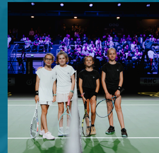
Open des Bretonnes