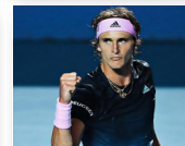
ALEXANDER ZVEREV 2014