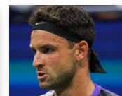
Grigor DIMITROV 2010