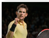
DOMINIC THIEM 2012 - 2013 - 2022