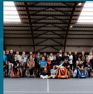
Open Together by Neosoft