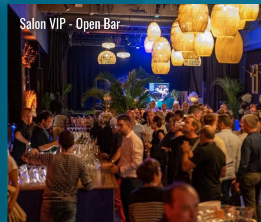
Salon VIP - Open Bar

Décoration intérieure réalisée par CRÉATION d'AMBIANCE Conception et réalisation de vos espaces