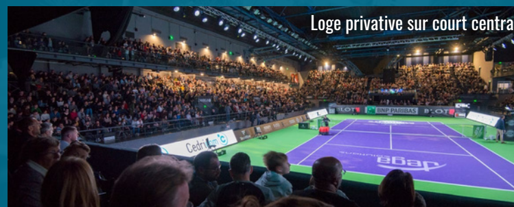
Loge privative sur court central