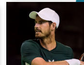
ANDY MURRAY 2021