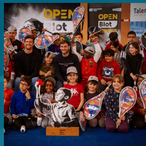
Open en Quartiers by Pierre Promotion

L'Open est signataire des 15 engagements éco-responsables du Ministère des sports et de la WWF (recyclage des balles, achats responsables...)