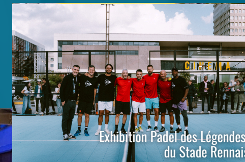
Exhibition Padel des Légendes du Stade Rennais

Décoration intérieure réalisée par CRÉATION d'AMBIANCE Conception et réalisation de vos espaces