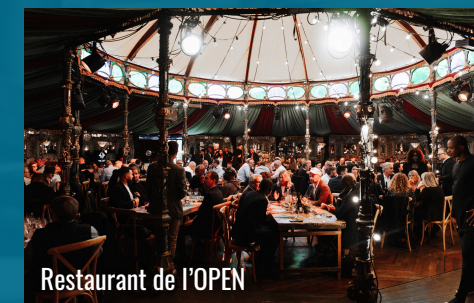
Restaurant de l'OPEN