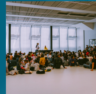
Open des Scolaires