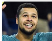
JO-WILFRIED TSONGA 2006