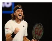
STÉPHANOS TSITSIPAS 2017